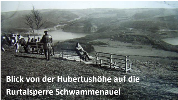
Blick von der Hubertushöhe auf die Rurtalsperre Schwammenauel