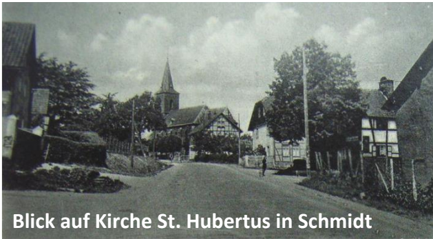
Blick auf Kirche St. Hubertus in Schmidt