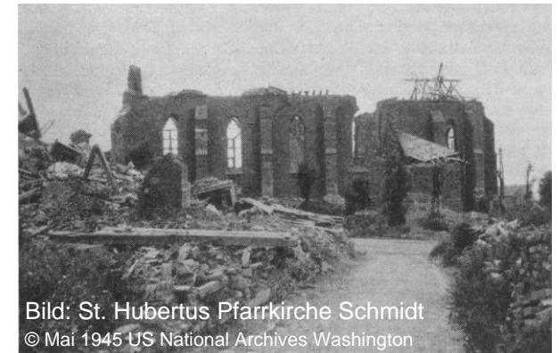
Bild: St. Hubertus Pfarrkirche Schmidt © Mai 1945 US National Archives Washington